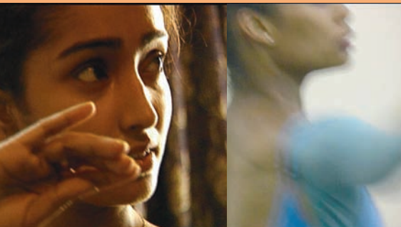
Abb. (v.l.n.r.): Krishna's Dancer, Behind the Curtain, Ein tanzender Stern, Phoenix Dance, Emotional Rescue